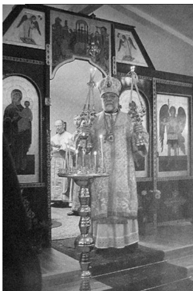
av januari 2007.