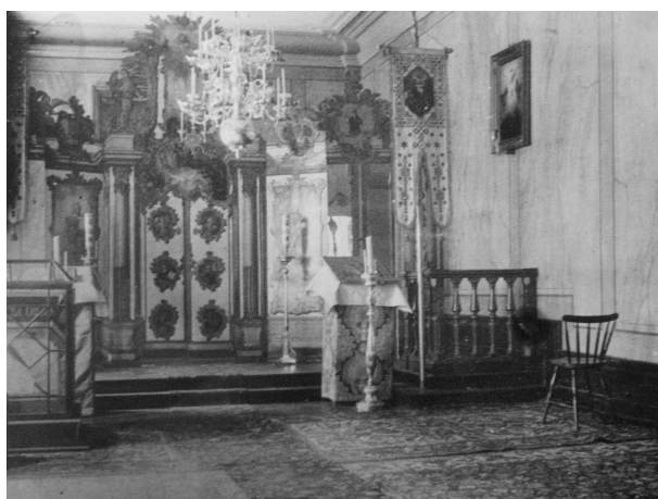
Ikonostasen i vår kyrka på Majorsgatan 9b, Stockholm, 1884

U nder Sjuårskriget andra hälften av 1700-talet ingick Ostpreussen en kort tid i det Ryska imperiet. År 1760 öppnades ortodoxa kyrkor i de tre strategiskt mest betydelsefulla städerna - i Königsberg Kristi Uppståndelses kyrka, i Pillau den Heliga Andes Nedstigandes kyrka och i Memel Kristi Förklarings kyrka. Till alla dessa kyrkor levererades samtidigt från Petersburg speciellt tillverkade ikonostaser. Till våra dagar har endast en av dem överlevt, den i Memel -